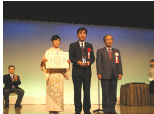
実行委員長、東京商工会議所副会頭吉野浩行氏との記念撮影