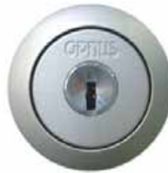
ディンプルキータイプ